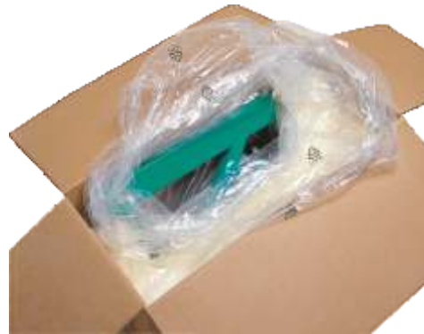
Mod ambalare si transport

Echipare de serie: Dispozitiv de siguranta Reducerator in baie de ulei Motor electric clasa S3 Cadru pregatit pentru suport ancorare