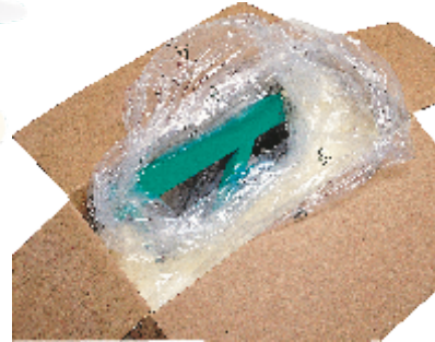
Mod ambalare si transport