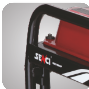
Cadru tratat pentru a preveni ruginirea