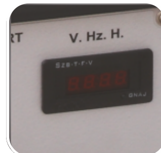
Contor ore, voltmetru si frecventa