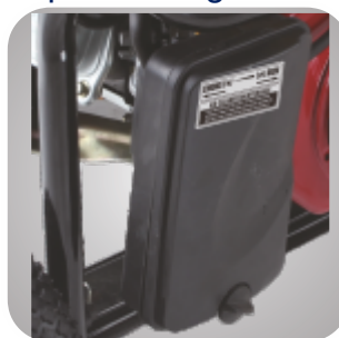
Filtru de aer patentat